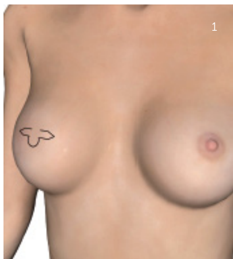
Optegning af brystvorte