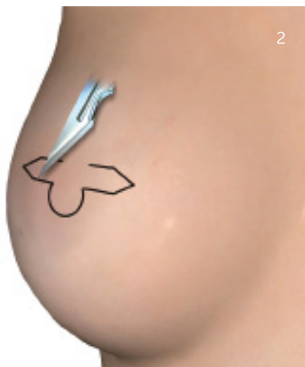
Snit langs optegning