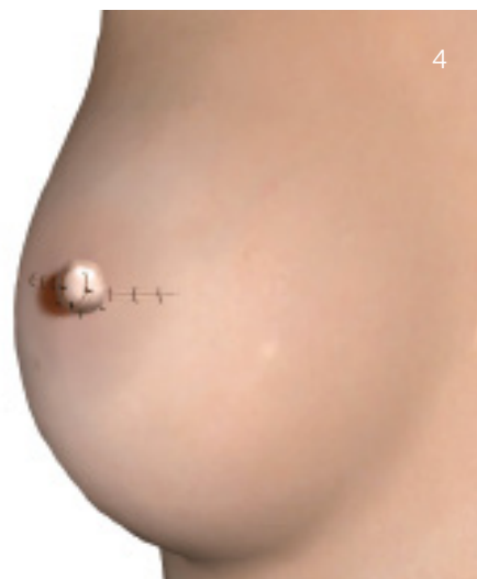
Lukning af såret med tråde