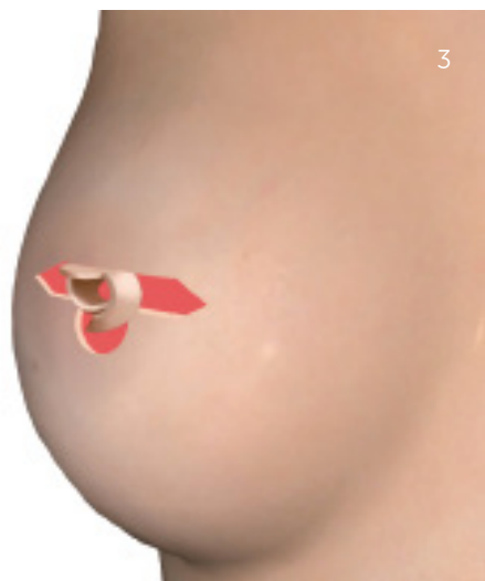
Formning af ny brystvorte